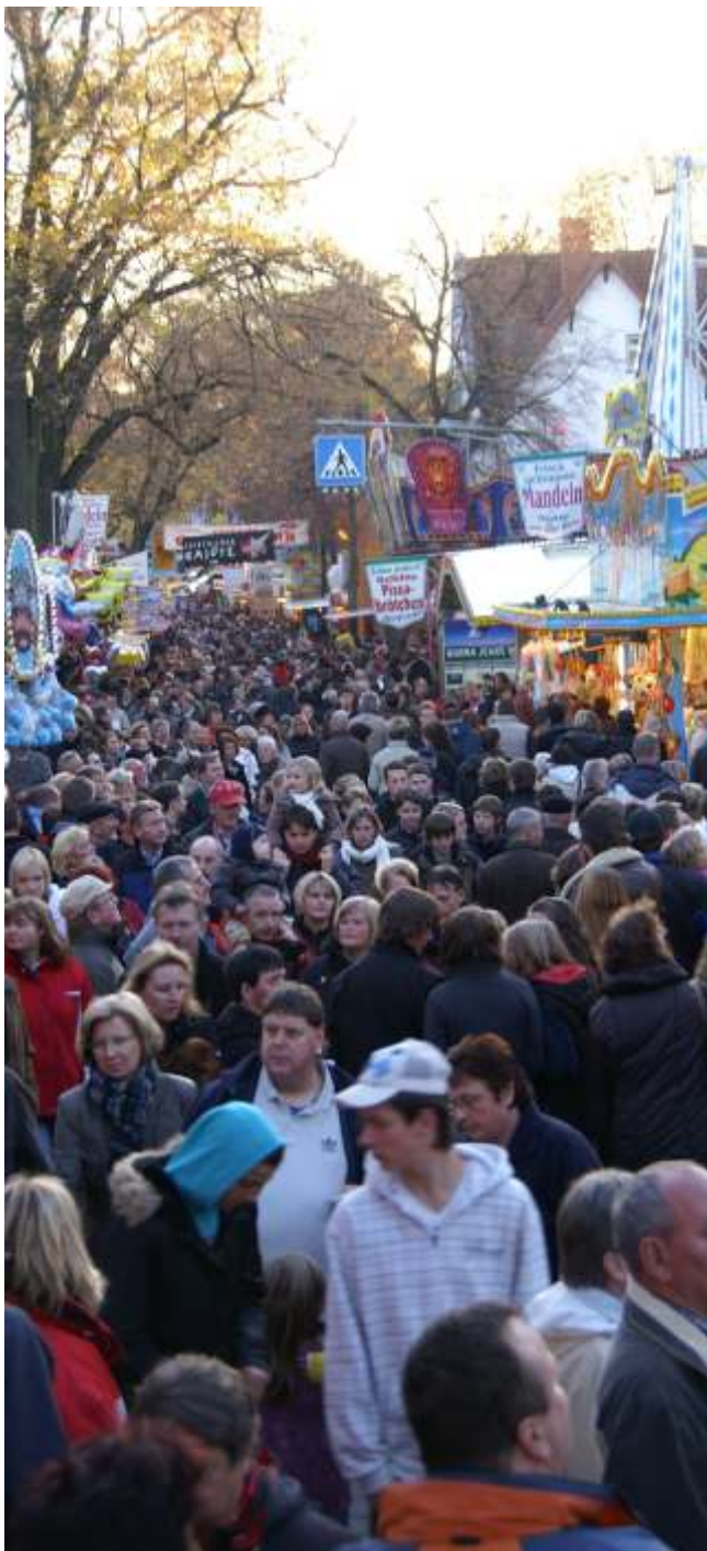
Blick vom Bahnhof in die Dominikanerstraße 2015